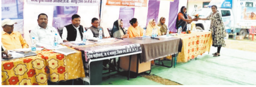
हरिभूमि न्यूज, मनेन्द्रगढ़

जिले के भरतपुर जनपद अंतर्गत ग्राम पंचायत माड़ीसरई में रजत जयंती महोत्सव का आयोजन अत्यंत हर्षोल्लास और ग्रामीण उत्साह के साथ संपन्न हुआ। कार्यक्रम का मुख्य उद्देश्य कृषकों को विभिन्न विभागों की योजनाओं की जानकारी देना और उन्हें आत्मनिर्भरता की दिशा में प्रोत्साहित करना था।