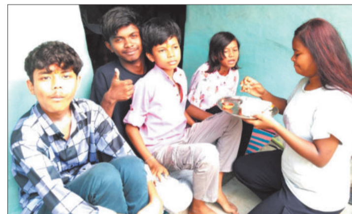
भाईदूज पर पूजा-अर्चना करती बहन।

सजाकर भाइयों के माथे पर चावल और कुमकुम का तिलक लगाया, सिर पर फूल चढ़ाए और मिठाई व पकवान खिलाए। भाइयों ने भी अपनी बहनों को उपहार, वस्त्र