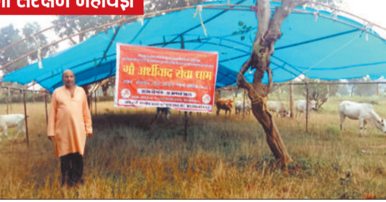
पाले जा रहे गौवंश।