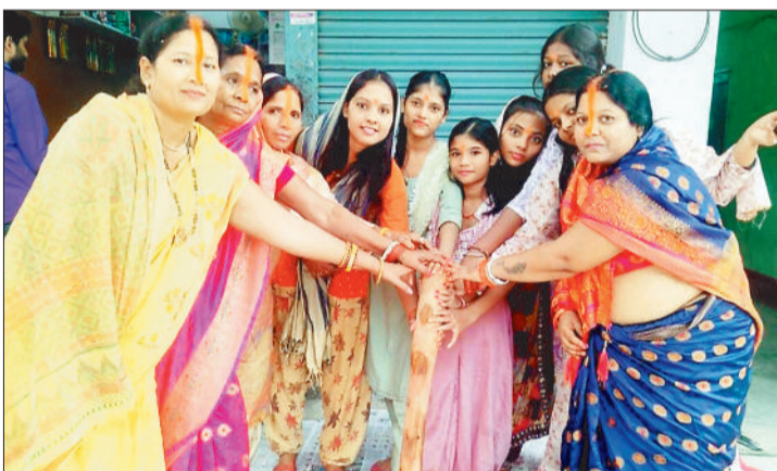
भाईदूज पर पूजा-अर्चना करती बहन।